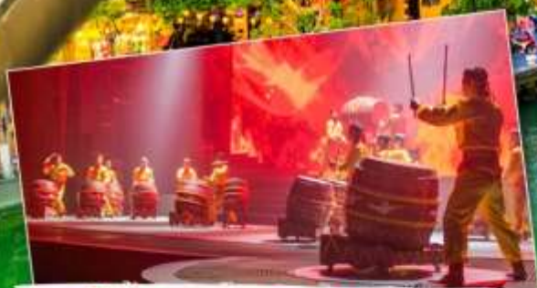
ชมโชว์แสง สี เสียงดำนัง