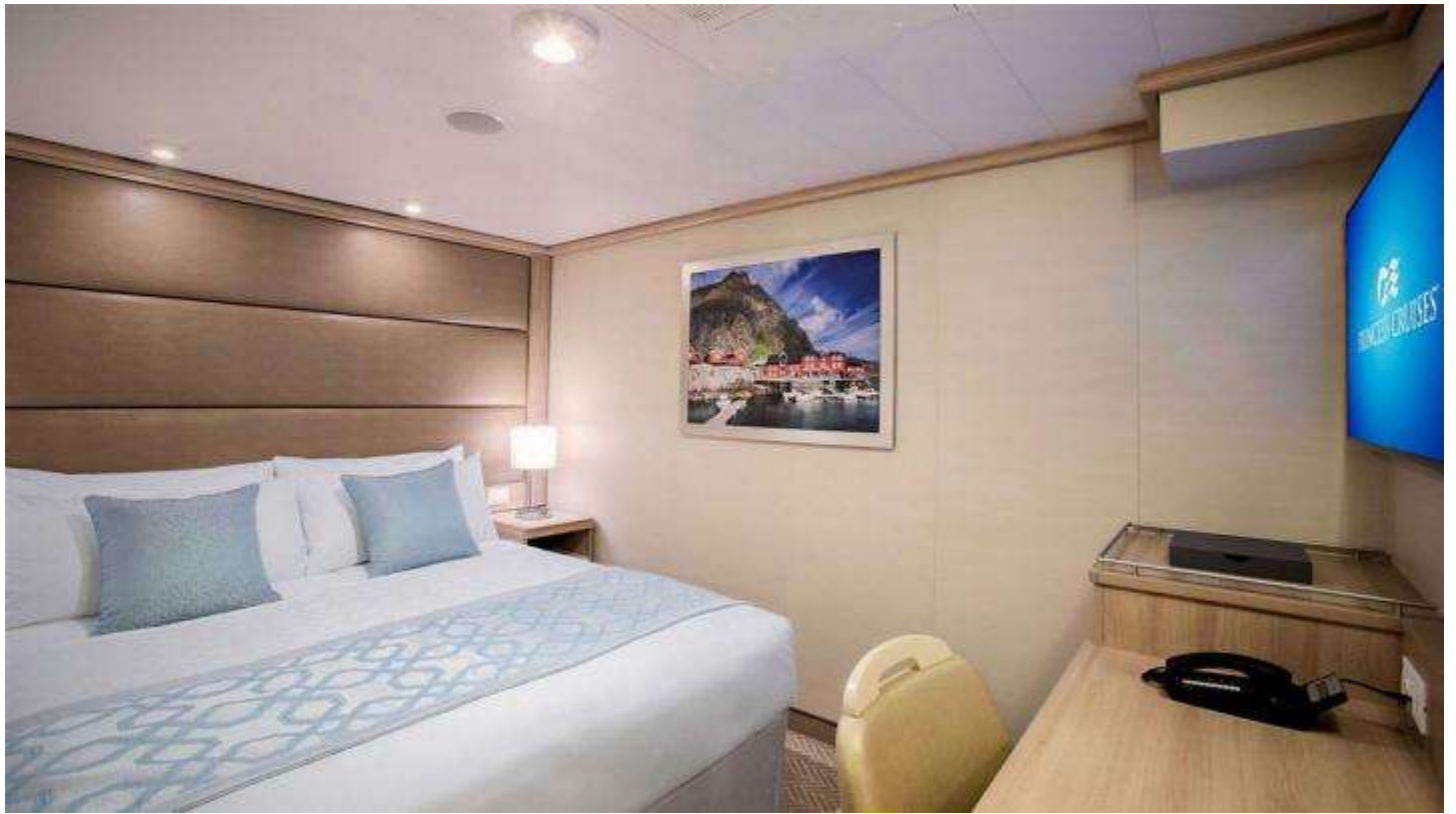
ห้องพักแบบ INSIDE ROOM