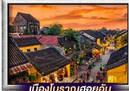
เมืองโบราณฮอยอัน