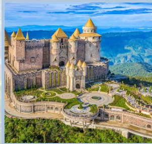
ปราสาทจันทร