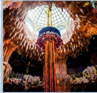
สวนสนุก Fantasy Park

ห้ามพลาด !! สัมผัสประสบการณ์ใหม่ไปกับ รถรางอัลไพน์โคสเตอร์ (ALPINE COASTER) นั่งรถรางชมธรรมชาติ เครื่องเล่นที่เป็นที่นิยมของประเทศเวียดนาม รถรางเล็กบังคับด้วยมือ สามารถควบคุมให้ช้าหรือเร็วได้ ปลอดภัย สามารถนั่งได้ 2 คน เชิญท่านสนุกสนานกับรถรางและชมธรรมชาติของเขานานาฮิลล์