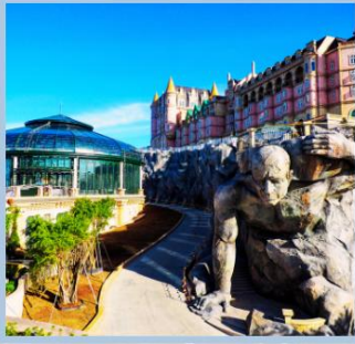
หมู่บ้านฝรั่งเศส