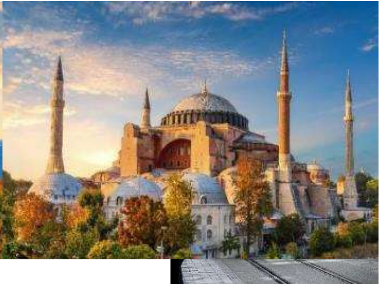
กรุงอิสตันบูล