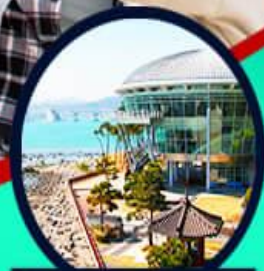
เอเปคเฮาส์ บูริมารุ