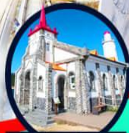
โบสถ์คริสต์จุกซอง