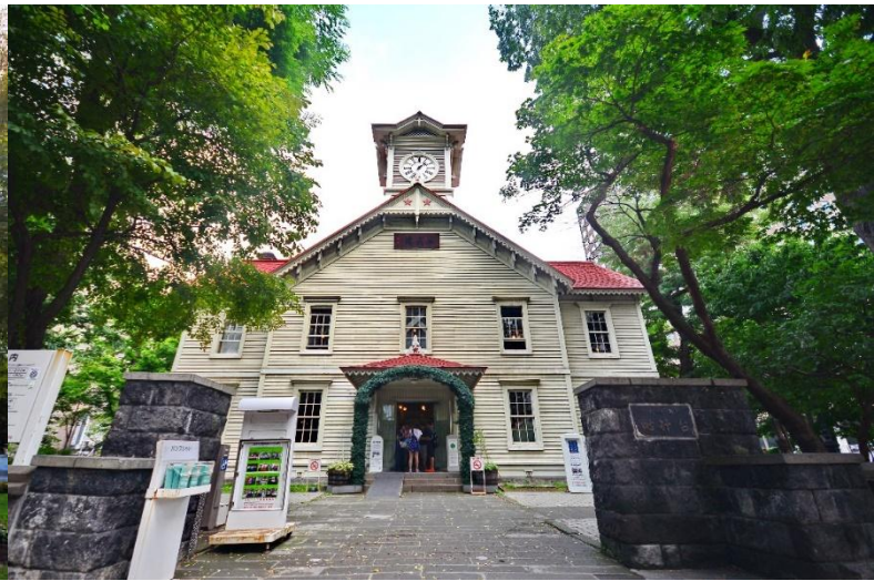
ชั่วโมง เพื่อบอกเวลา