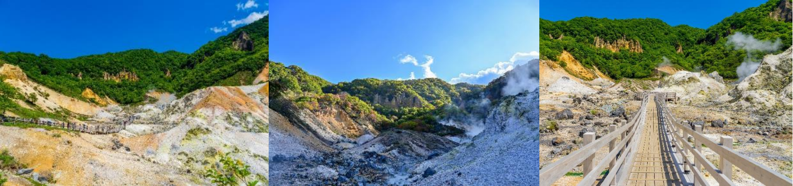
ถ่ายภาพหรือได้ดื่มกาแฟ ท่านอาหารท่ามกลางวิวทิวทัศน์อันสวยงามแห่งนี้ (ค่าทัวร์รวมค่าขึ้น-ลงกระเช้า)

ชมวิวมุมสูงถ่ายภาพสุดเท่ พร้อมวิว ภูเขาไฟอุซุซุ (Usuzan) โดย กระเช้าภูเขาอุซุซุ (MT. Usuzan Ropeway) เป็นภูเขาไฟที่ยังคุกรุ่นอยู่ มีอายุกว่า 20,000 ปีมาแล้ว มีความสูง 737 เมตร และเมื่อขึ้นไปด้านบน ยังมีร้านค้าหลากหลายร้าน ไม่ว่าจะเป็น ร้านกาแฟ ร้านจำหน่ายของที่ระลึก และร้านอาหารเปิดให้บริการ อิสระให้ทุกท่าน