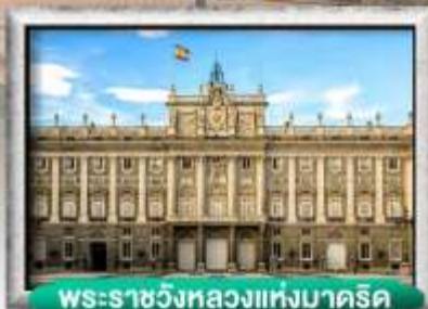
พระราชวังหลวงแห่งมาดริด