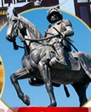
ซามูไรดาเกียว