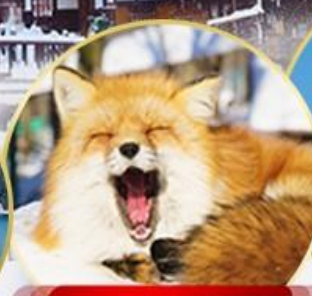
หมู่บ้านจิ้งจอกซาโอะ