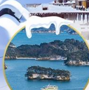
อ่าวมัตสึชิม่า