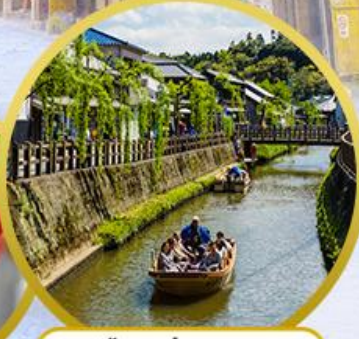
เมืองเก่าซาวาระ