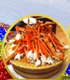
บุฟเฟ่ต์ซาปู