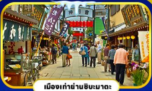
เมืองเก่าย่านชิบะมาตะ