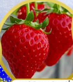
บุฟเฟ่ต์สตรอว์เบอร์รี่