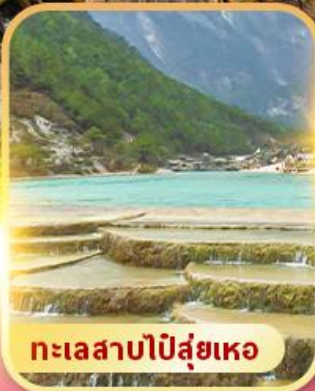
ทะเลสาบป๋อสูยเหอ