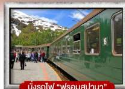
นั่งรถไฟ "พร้อมสปา"

พิเศษ! พักนเรือสำราญ แบบ Window Room 2 คืน, บ้านซานต้าคลอส