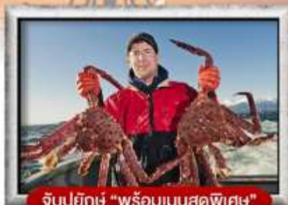
จับปูยักษ์ "พร้อมเมนูสุดพิเศษ"