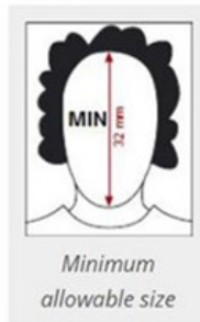
Minimum allowable size