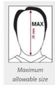
Maximum allowable size