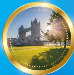
SUMMER มิถุนายน-สิงหาคม 13 °C - 23 °C