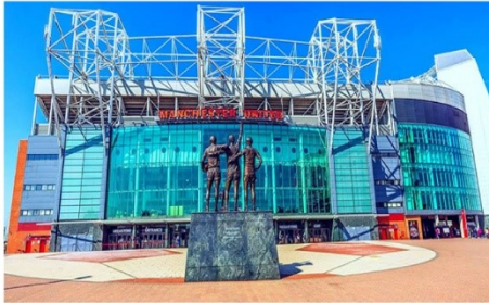
แมนเชสเตอร์