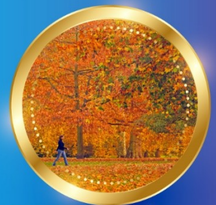
AUTUMN กันยายน-พฤศจิกายน 7 °C - 19 °C