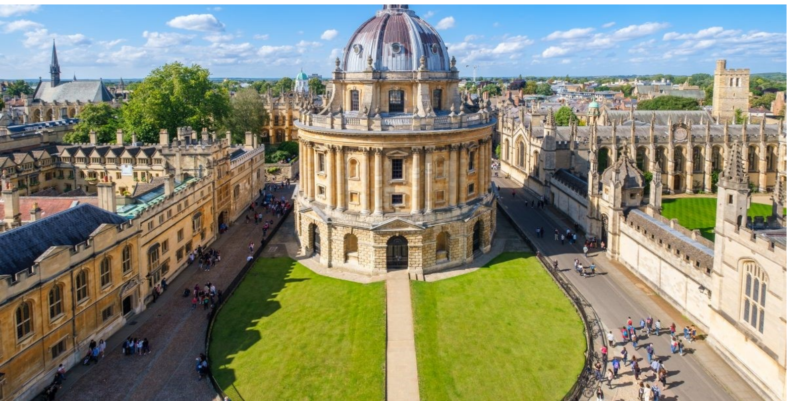
Day 5 ออกซ์ฟอร์ดชมเมือง - วอร์เนอร์บราเธอร์ แอร์พोटเตอร์ สตูดิโอ - ย่านไนท์บิงค์ ห้างแฮรอดส์

เช้า🍷 บริการอาหารเช้า ห้องอาหารของโรงแรม