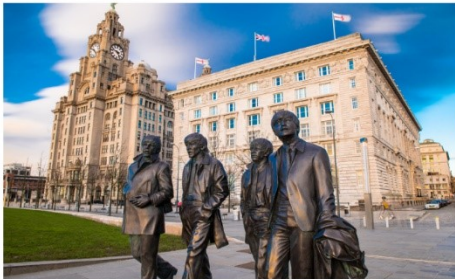
ลิเวอร์พูล