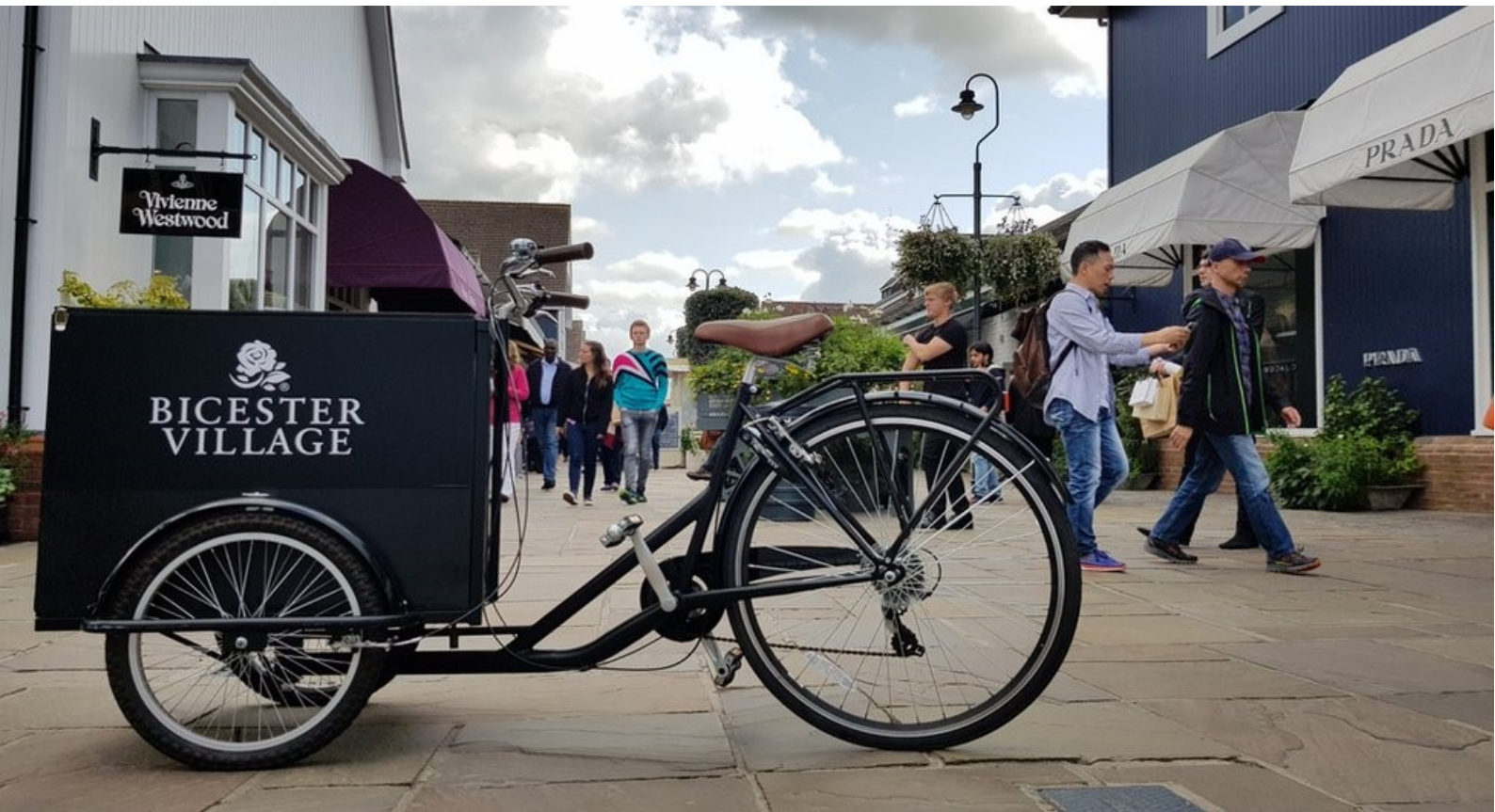
พัก Holiday Inn Express Bicester หรือเทียบเท่า