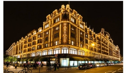
ห้างแฮร์รอดส์