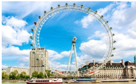
ลอนดอนอาย