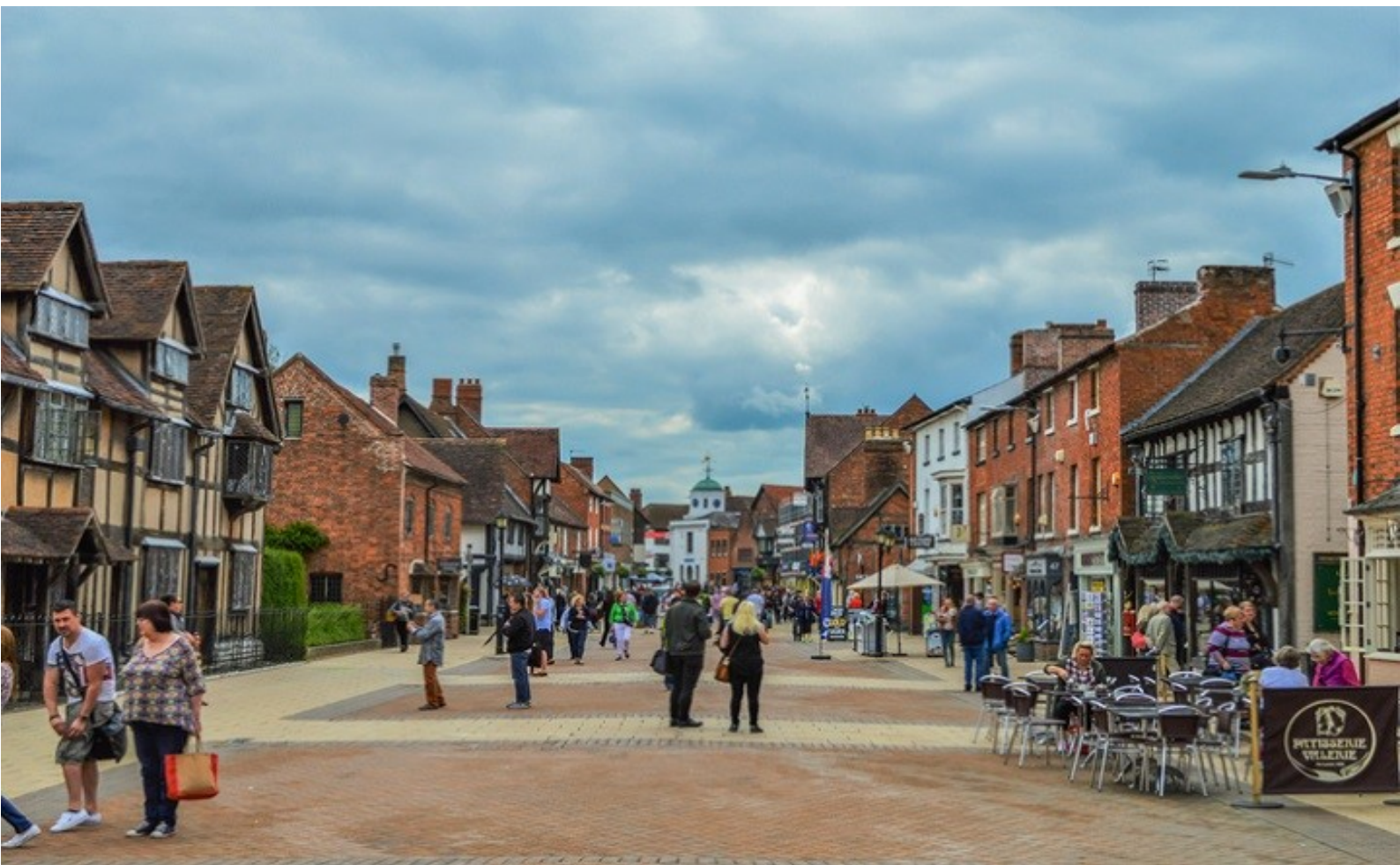
เที่ยง | บริการอาหารกลางวัน ณ ภัตตาคาร