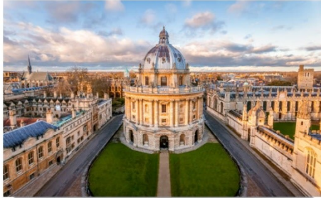
อ็อกฟอร์ด