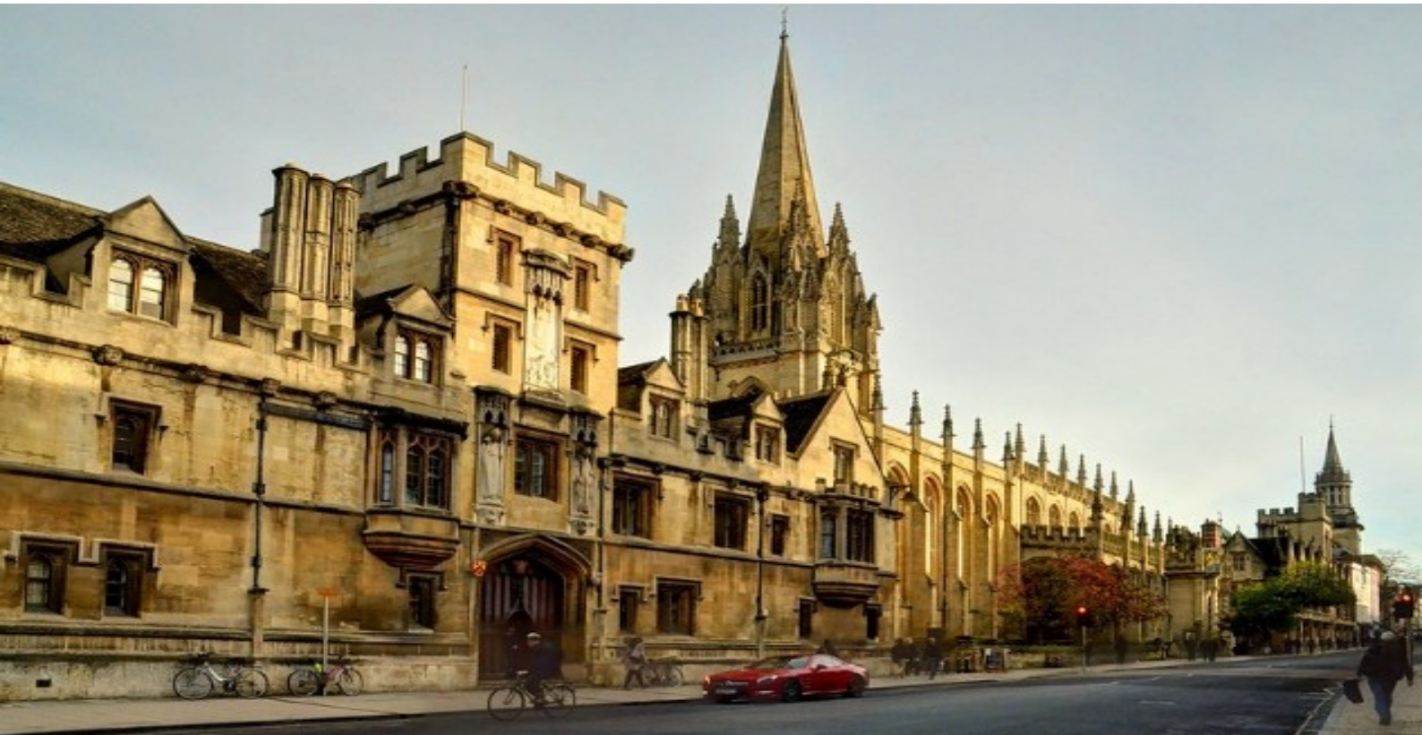
โบสถ์เซนต์แมรี เป็น โบสถ์ที่เก่าแก่ที่สุดในหมู่บ้าน บ่งบอกถึงประวัติศาสตร์ที่สำคัญของอังกฤษอีกแห่งหนึ่ง