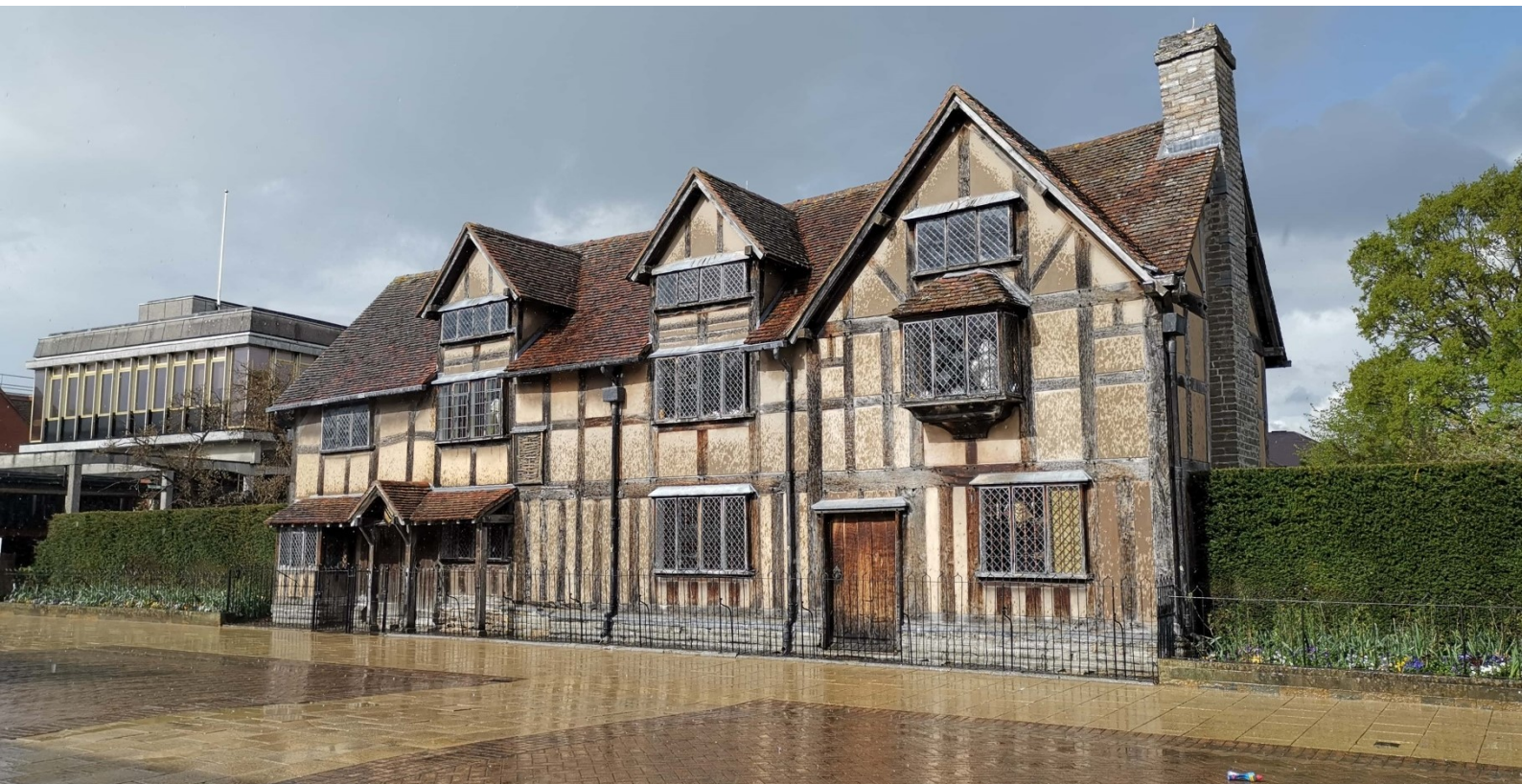
นำท่านเดินทางสู่ เมืองสแตรทฟอร์ด-อัฟอน-เอวอน (ใช้เวลาเดินทางประมาณ 1 ชั่วโมง) เมืองที่มีความสำคัญด้านวรรณกรรมของอังกฤษ เนื่องจากเป็นบ้านเกิดของวิลเลียมส์ เช็คสเปียร์ กวีเอกผู้ยิ่งใหญ่ของโลก ถ่ายรูปบ้านเกิดเช็คสเปียร์ เป็นบ้านกึ่งปูนกึ่งไม้สไตล์ทิวดอร์ 2 ชั้น รอบบ้านตกแต่งด้วยสวนสไตล์อังกฤษ ต่อด้วย ถนนสายช้อปปิ้ง ที่เต็มไปด้วยร้านของฝาก คาเฟ่ มากมาย