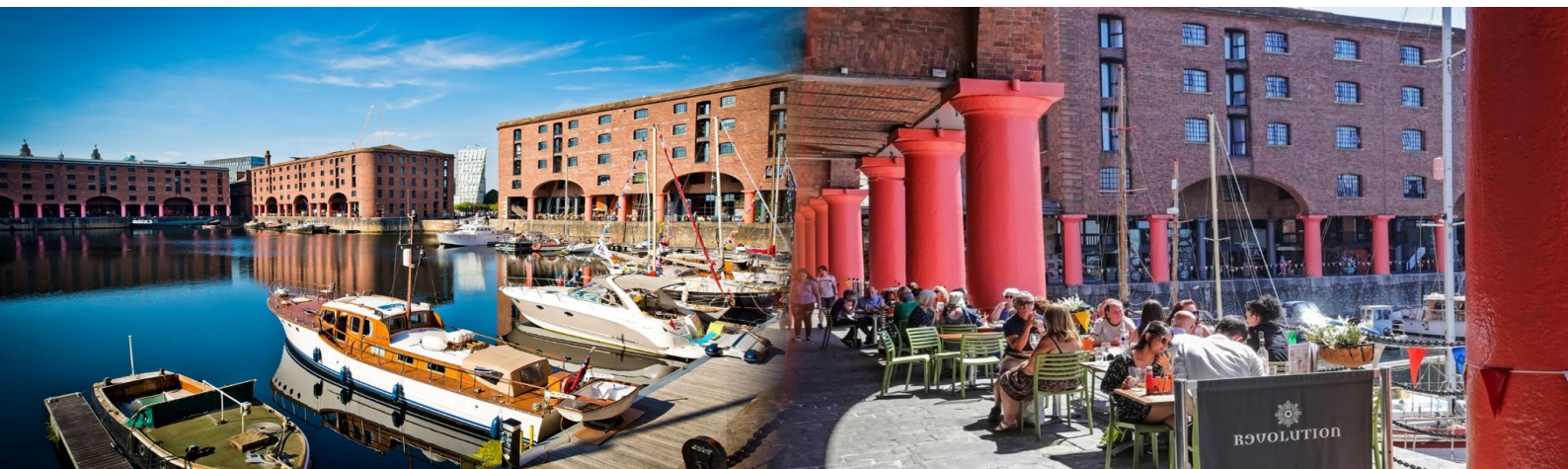
พัก Adelphi Hotel หรือเทียบเท่า