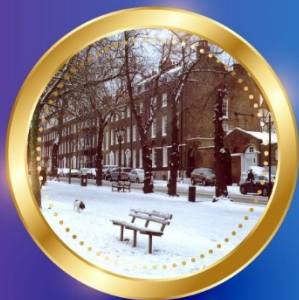
WINTER ธันวาคม-กุมภาพันธ์ 2 °C - 11 °C