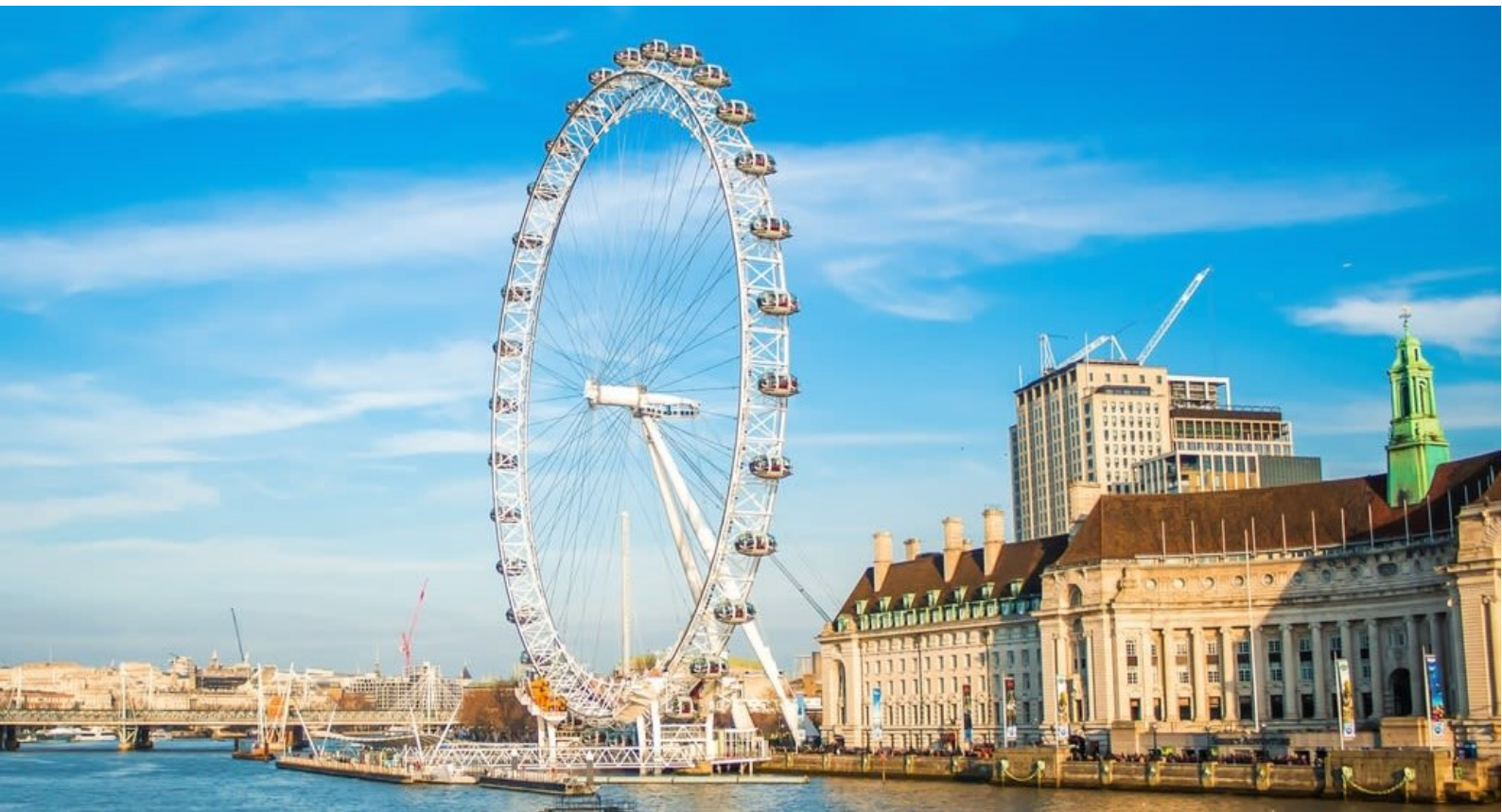
ลอนดอนอาย ซิงช้าสวรรค์ที่สร้างด้วยโครงเหล็กค้ำเพียงข้างเดียวที่สูงที่สุดในโลก