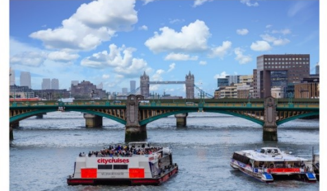
ล่องเรือแม่น้ำเทมส์