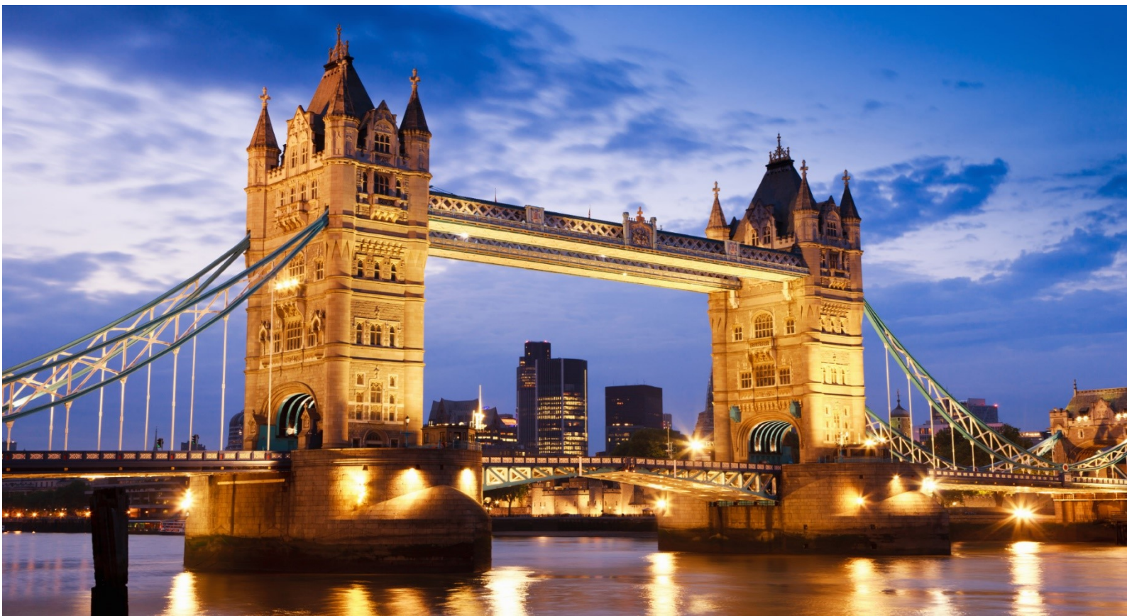
พัก Ibis City Shoreditch หรือเทียบเท่า