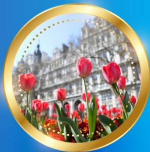
SPRING มีนาคม-พฤษภาคม 4 °C - 19 °C