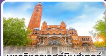
มหาวิหารเวสต์มินสเตอร์