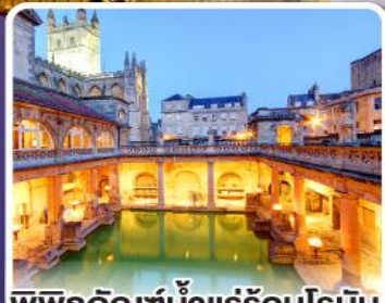
พิพิธภัณฑ์น้ำแร่ร้อนโรมัน

ตื่นตาตื่นใจ กับเสาหินสโตนเฮนจ์ 1 ใน 7 สิ่งมหัศจรรย์ของโลก