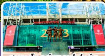
สนามโอลด์แทรฟฟอร์ด