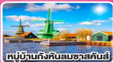
หมู่บ้านกังหันลมชาสคินส์