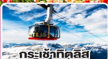
กระเช้าทิทลิส