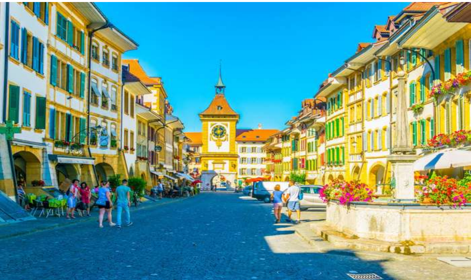
ถ่ายภาพกับนาฬิกา ไซท์ กล็อคเค่น อายุ 800 ปี ที่มี "โซร์" ให้ดูทุกๆ ชั่วโมงที่นาฬิกาตีบอกเวลา