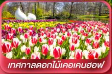
เทศกาลดอกไม้เคอเคนฮอฟ