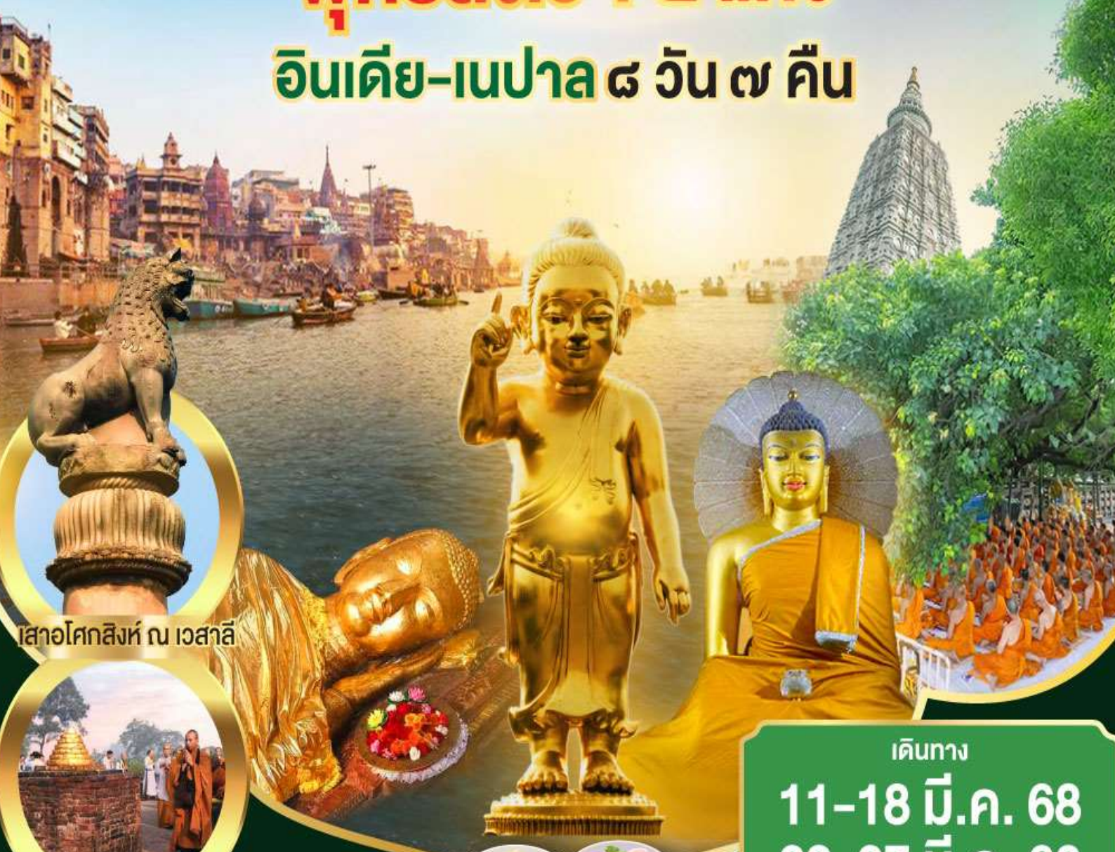
เสาอโศกสิงห์ ณ เวสาลี