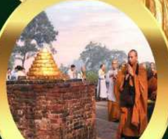
เชตวันมหาวิหาร เมืองสาวัตถี