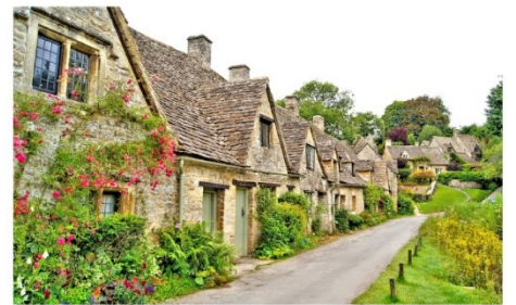
หมู่บ้านโบมัวร์