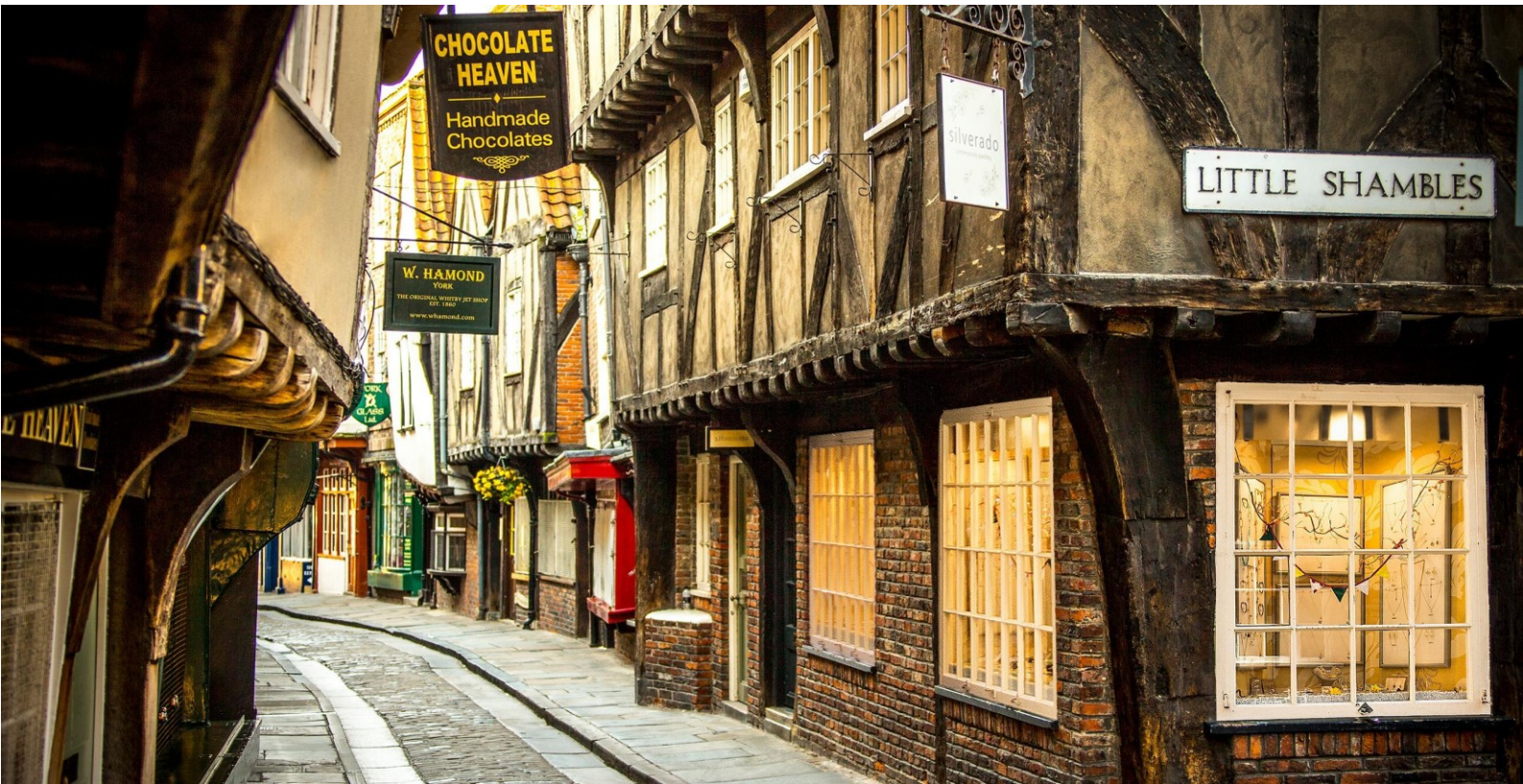
พัก Novotel York Centre หรือเทียบเท่า