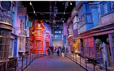
วอร์เนอร์บราเธอร์ สตูดิโอ