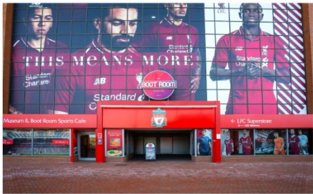
ลิเวอร์พูล