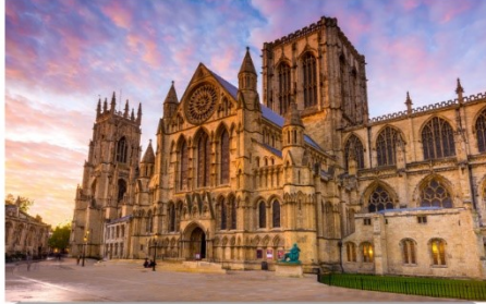
มหาวิหารยอร์ก