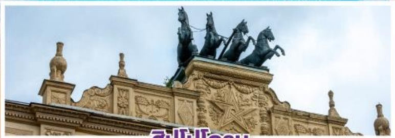
ฮิปโปโดรม