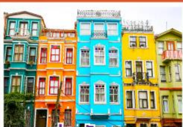
ย่านบิลลาท

เดินทาง 08-15 เม.ย. 68 30 เม.ย. - 07 พ.ค. 68