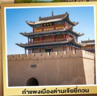
กำแพงเมืองฉ่านเจียอี้กวน