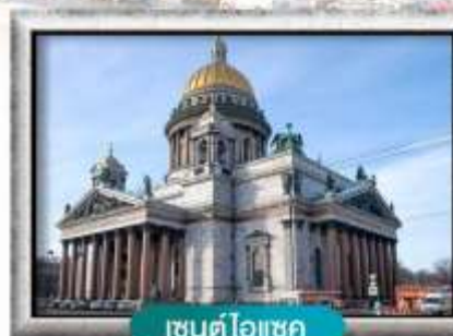
เซนต์ไอแซค