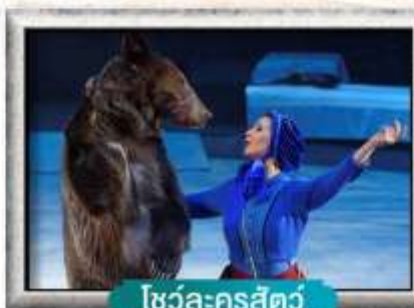
โซวล์-ครสต์ว์