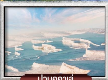
ปามุกคาล่