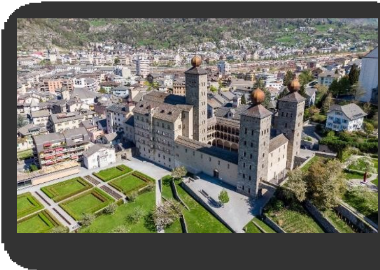
ถนนเทวดา เทน