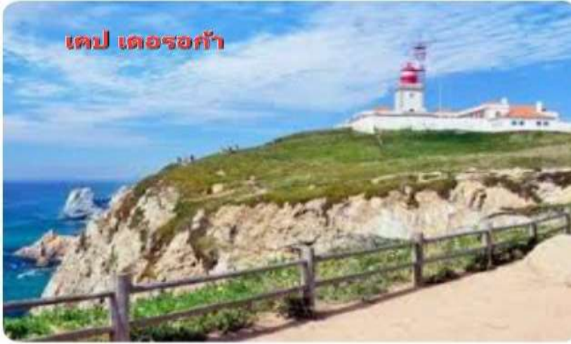
เคป เดอรอก้า

จากนั้นนำท่านเดินทางเลาะเลียบชายฝั่งมหาสมุทรแอตแลนติก ผ่านเมืองเล็ก ๆ น่ารักแถบชายเมืองลิสบอน เพื่อเดินทางสู่ เคป เดอรอก้า ซึ่งเป็น จุดตะวันตกสุดของทวีปยุโรป เป็นพื้นที่ที่มีแผ่นดินเป็นที่สุดท้าย ก่อนเป็นมหาสมุทรแอตแลนติก