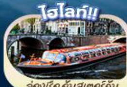
คลองเรือ อัมสเตอร์ดัม

“ตำนานเด็กยีนดี้ สัญลักษณ์แห่งกรุงบรัสเซลส์ แมนเนเกน พิส มหาวิหารโคโลญ” สะพานไอเอ็นชอลาสิร์น ล่องเรือชมหมู่บ้านทีโรน กังหันลมชาเนลส์คินส์ คลองอัมสเตอร์ดัม บรัสเซลส์ อะโตเมียม จัตุรัสบรูจส์ หอไอเฟล จัตุรัสคองคอร์ด พิพิธภัณฑ์ลูฟร์ ล่องเรือแม่น้ำแซน ซ็อบบิงแบบจุใจที่ฝั่งซันน่า