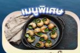
ของแถมพิเศษ

เดินทาง 9 - 16 พ.ค.68 19 - 26 พ.ค.68 26 พ.ค. - 2 มิ.ย.68