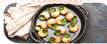
พายโฮลแลนดิค