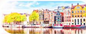
คลองอัมสเตอร์ดัม