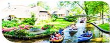
คลองเรือชมหมู่บ้านทีโรน