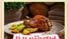
เมนูพิเศษ ขาหมูเยอรมัน