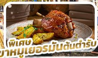
พิเศษ ขามูเยอรมัน ต้อนรับ