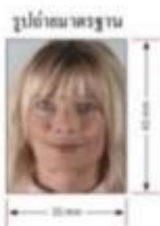
รูปถ่ายมาตรฐาน