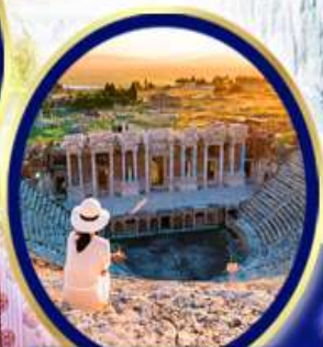
นครเฮียราโพลิส