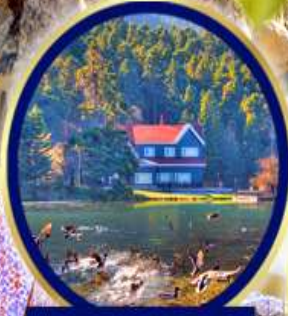
ทะเลสาบโกลจุค