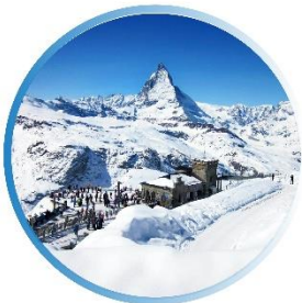
WINTER ธันวาคม-กุมภาพันธ์ -3 °C - 6 °C