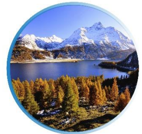
AUTUMN กันยายน-พฤศจิกายน 7 °C - 13 °C