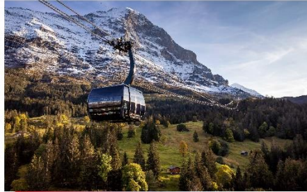
ขึ้นกระเช้า