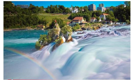
น้ำตกโรน