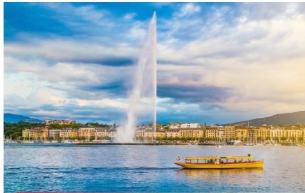
น้ำพุ Jet d'Eau