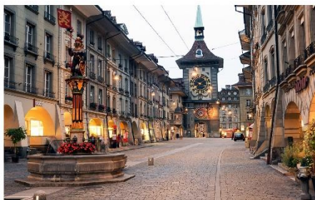
กรุงเบิร์น