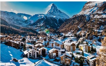
หมู่บ้านเซอร์แมท