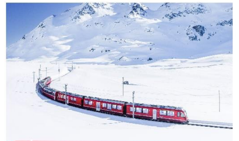
นั่งรถไฟ