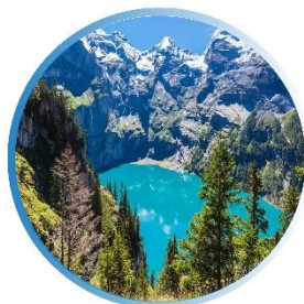
SUMMER มิถุนายน-สิงหาคม 6 °C - 13 °C