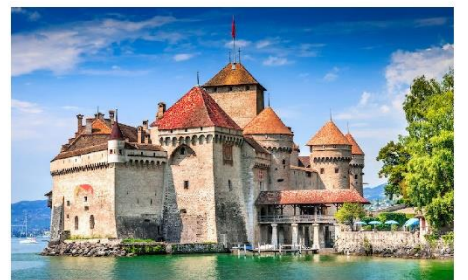
ปราสาทซิลยอง