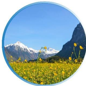
SPRING มีนาคม-พฤษภาคม 6 °C - 13 °C