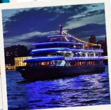
BOSPHORUS CRUISE & DINNER SHOW