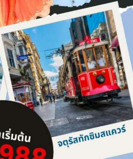
จตุรัสทักซิมสแควร์