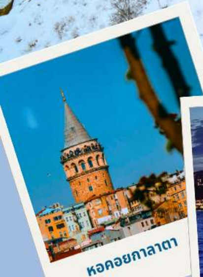
หอคอยกาลาตา