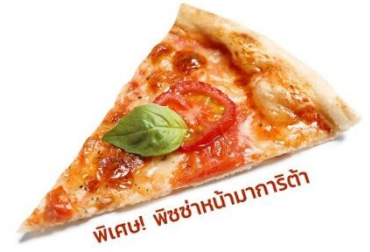
พิเศษ! พิซซ่าหน้ามากริต้า

(ชื่อโรงแรมที่ท่านพัก ทางบริษัทจะทำการแจ้งพร้อมใบนัดหมาย 5-7 วันก่อนวันเดินทาง)