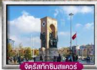
จัตุรัสทักซิมสแควร์