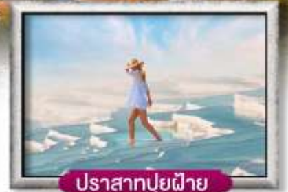
ปราสาทปุยฝ้าย