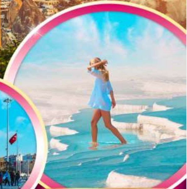
ปราสาทปูญา