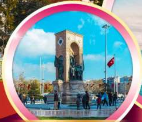
จัตุรัสทักซิมสแควร์