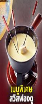
เมนูพิเศษ สวิสฟองดู