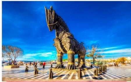
เมืองชานักคาเล