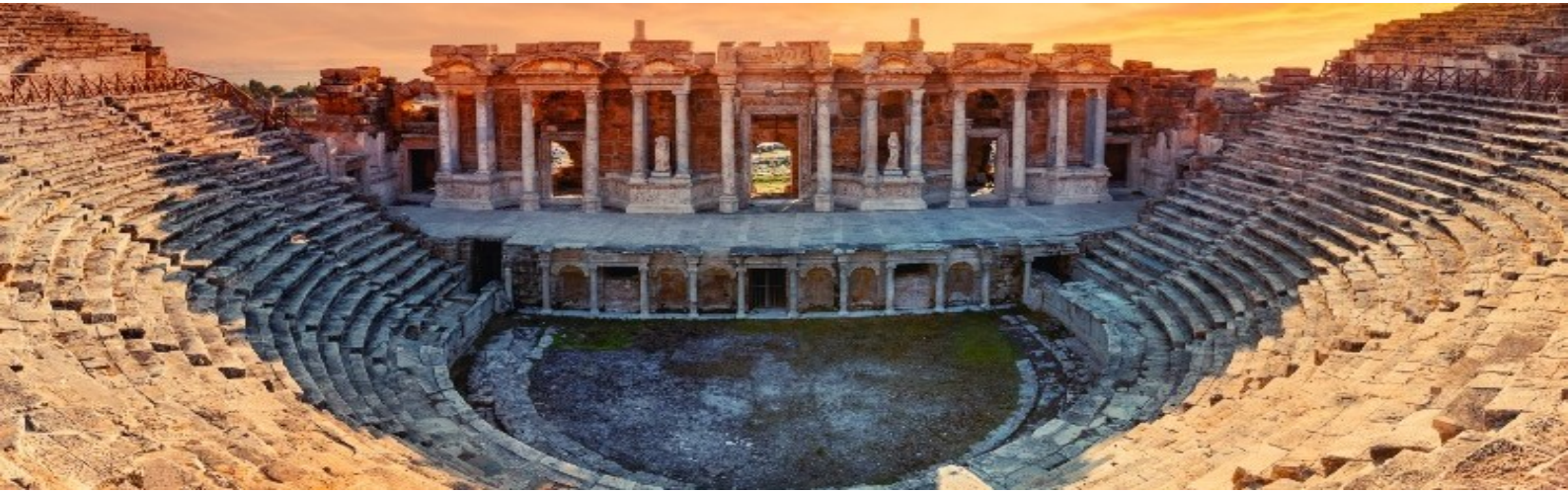
พัก Tripolis Hotel หรือเทียบเท่า