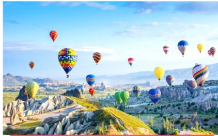
แคปฟาโดเซีย