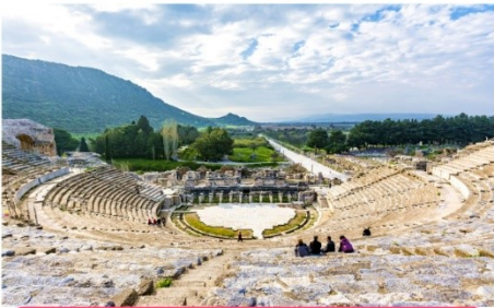
นครโบราณเฮียราโปลิส