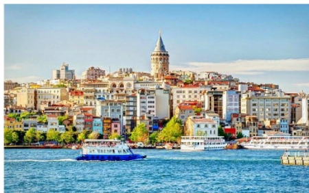
ล่องเรือช่องแคบบอสฟอรัส