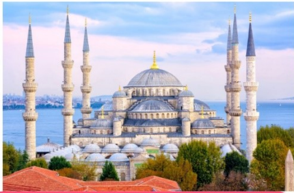
มัสยิดสีฟ้า