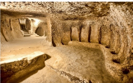
นครใต้ดิน