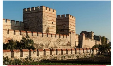
กำแพงประวัติศาสตร์คอนสแตนติโนเปิล