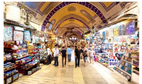
ตลาดสีปชมาร์เกต