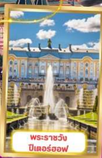
พระราชวัง ปีเตอร์ฮอฟ