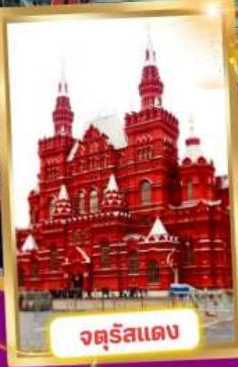
จตุรัสแดง