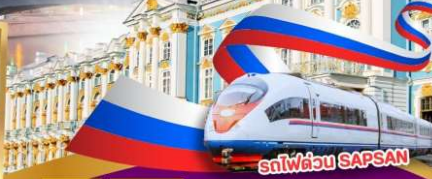
รถไฟด่วน SAPSAN