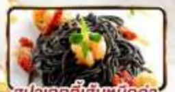
พิซซาลาโดล้ออิตาลีเลียนแท้ สปาเกตตีเส้นหมึกดำ