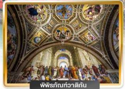
พิพิธภัณฑสถาน