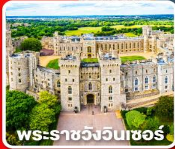
พระราชวังวินด์เซอร์

พักผ่อนนอน 4 คืนและ อิสระให้ท่านได้เที่ยวลอนดอนแบบเต็มอิ่ม 1 วัน