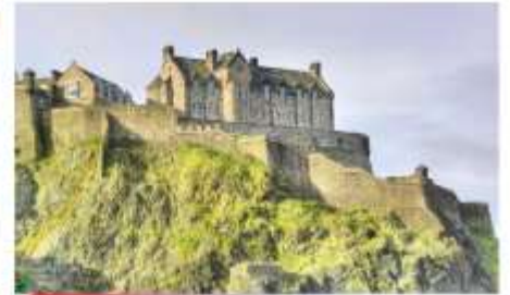
ปราสาทเอ็ดินเบิร์ก