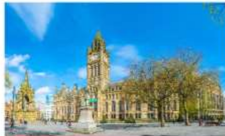
แมนเชสเตอร์