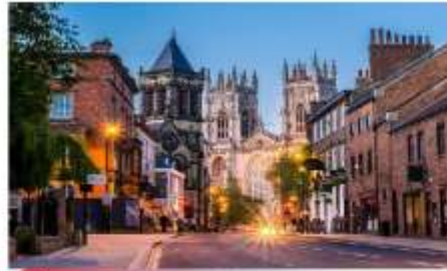
เมืองยอร์ก