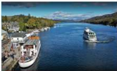
ทะเลสาบติสตีร์กัตต์