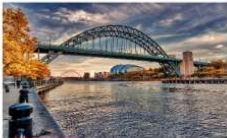
นิวคาสเซิล