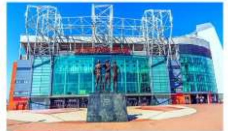
สนามโอลด์แทรฟฟอร์ด