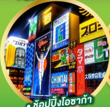
• ช้อปปิ้งโอซาก้า