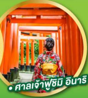
• ศาลเจ้าฟูชิมิ อินาริ