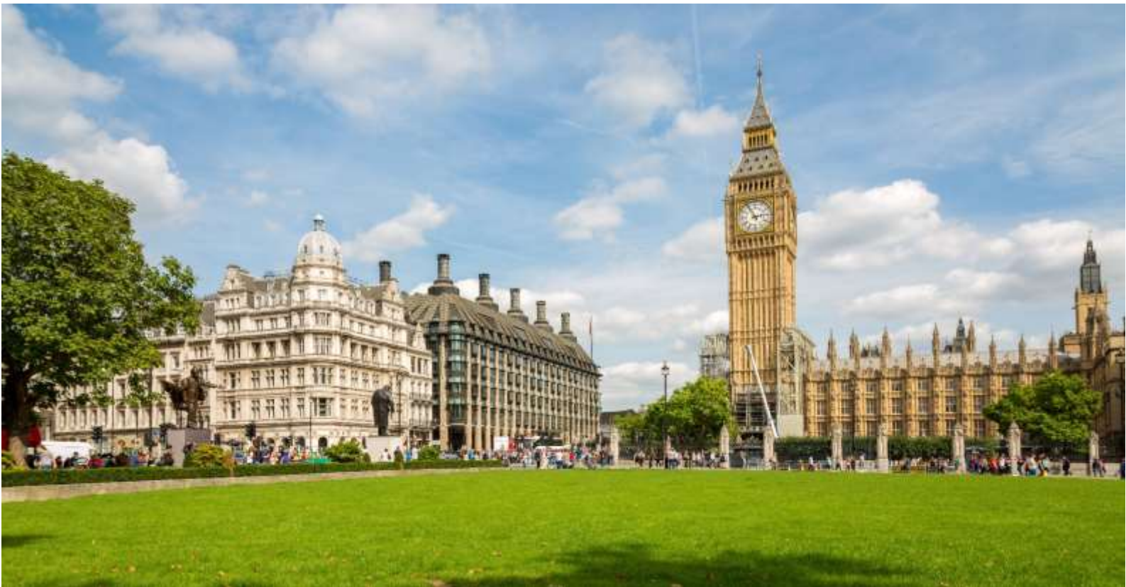
ลอนดอนในการถ่ายทอดเสียงการตีระฆังไปทั่วโลก

นำท่านเดินทางสู่ จัตุรัสทราฟัลกัวร์ (Trafalgar Square) จตุรัสกลางเมืองที่รายล้อมไปด้วยอาคารราชการสำคัญของเมืองลอนดอน นำท่านถ่ายรูปเป็นที่ระลึก กับ จัตุรัสรัฐสภา (Parliament Square) และ พระราชวังเวสต์มินสเตอร์ (Westminster Palace) หรือ ตึกรัฐสภาเวสต์มินสเตอร์ (Houses of Parliament) เป็นสถานที่ที่สภาสองสภาของรัฐสภาแห่งสหราชอาณาจักร (สภาขุนนาง และสภาสามัญชน) ใช้ประชุม สิ่งก่อสร้างส่วนใหญ่สร้างในคริสต์ศตวรรษที่ 19 แต่ก็ยังมีส่วนก่อสร้างเดิมเหลืออยู่บ้างเล็กน้อยรวมทั้งห้องพระโรงที่ในปัจจุบันใช้ในงานสำคัญๆ ได้รับการขึ้นทะเบียนให้เป็นมรดกโลกโดยองค์การสหประชาชาติ หรือ ยูเนสโก เมื่อปี ค.ศ. 1987 นำท่านถ่ายภาพคู่กับ หอนาฬิกาบิกเบน (Big Ben) ของกรุงลอนดอนประเทศอังกฤษ ตั้งอยู่บนหอสูง 180 ฟุต หน้าปัดกว้าง 23 ฟุต ตัวเลขบอกเวลายาว 24 นิ้ว กระจกตีหนักถึง 14 ตัน สร้างขึ้นโดย เอ็ดมันด์ แมคเกตต์ เดนิสัน เป็นนาฬิกาที่ใหญ่ที่สุดในโลก เป็นศูนย์ควบคุมเวลามาตรฐานของโลกกรีนวิช ซึ่งใช้ในการบอกเวลาของโลกโดยผ่านทางวิทยุ BBC