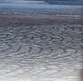
ล่องเรือแม่น้ำแซนชมเมืองปารีส