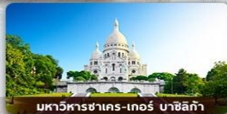
มหาวิหารซากร-เกอร์ มาซิลีก้า

หอไอเฟล พิพิธภัณฑ์ลูฟร์ พระราชวังแวร์ซาย จัตุรัสคองคอร์ดี ประตูชัยฝรั่งเศส