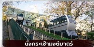
นั่งกระเช้ามงต์มาตร์