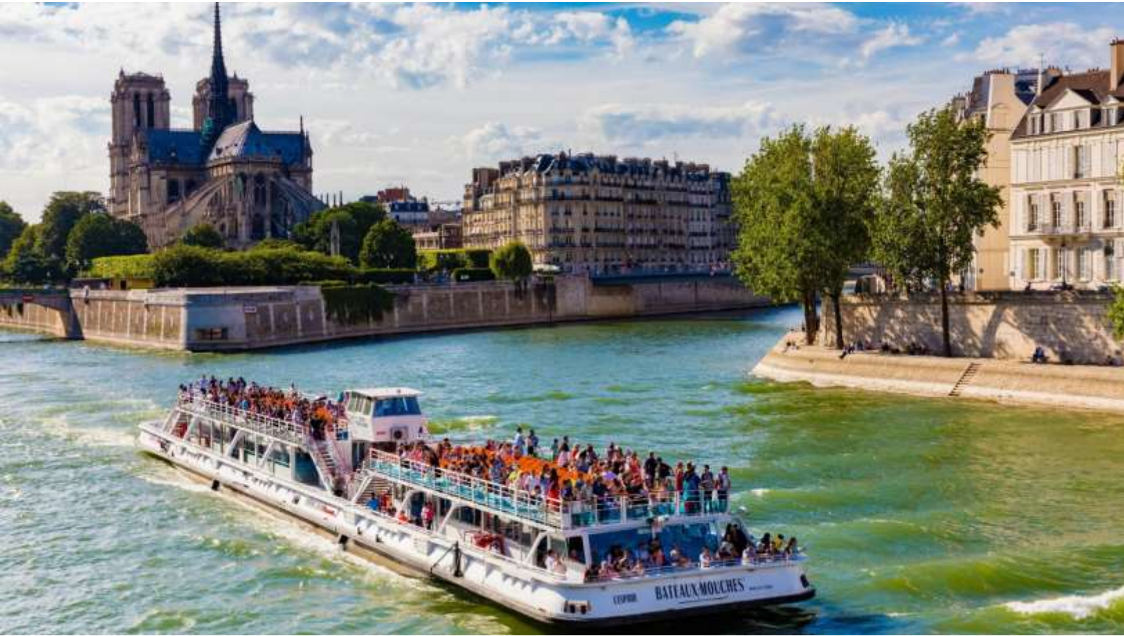
พักที่ IBIS HOTEL , PARIS หรือเทียบเท่า