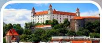
Bratislava Castle Courtyard