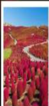
HITACHI SEASIDE PARK