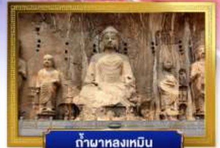
ถ้ำผาลงเหมิน