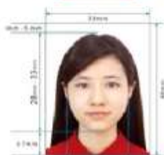
35mm x 45mm Paper Photo for Visa Application Form