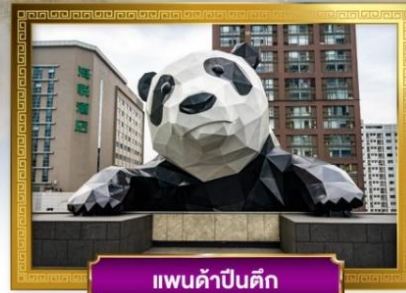
แพนด้าปิ่นตึก